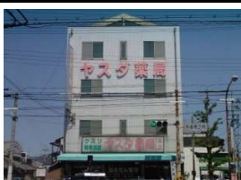
ヤスダ薬局 徒歩4分(330m)