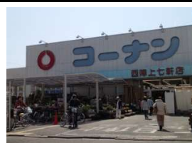
日曜大工「コーナン」 徒歩10分(780m)