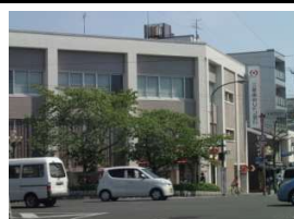
三菱東京UFJ銀行 徒歩11分(860m)